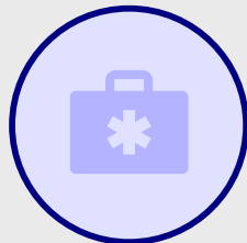
Helfer vor Ort